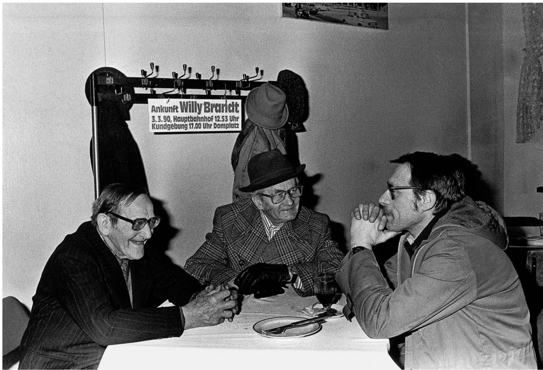
Der Osten hat auf den Westen nur gewartet: So erklärt das Deutsche Historische Museum die Vereinigung der beiden Staaten.