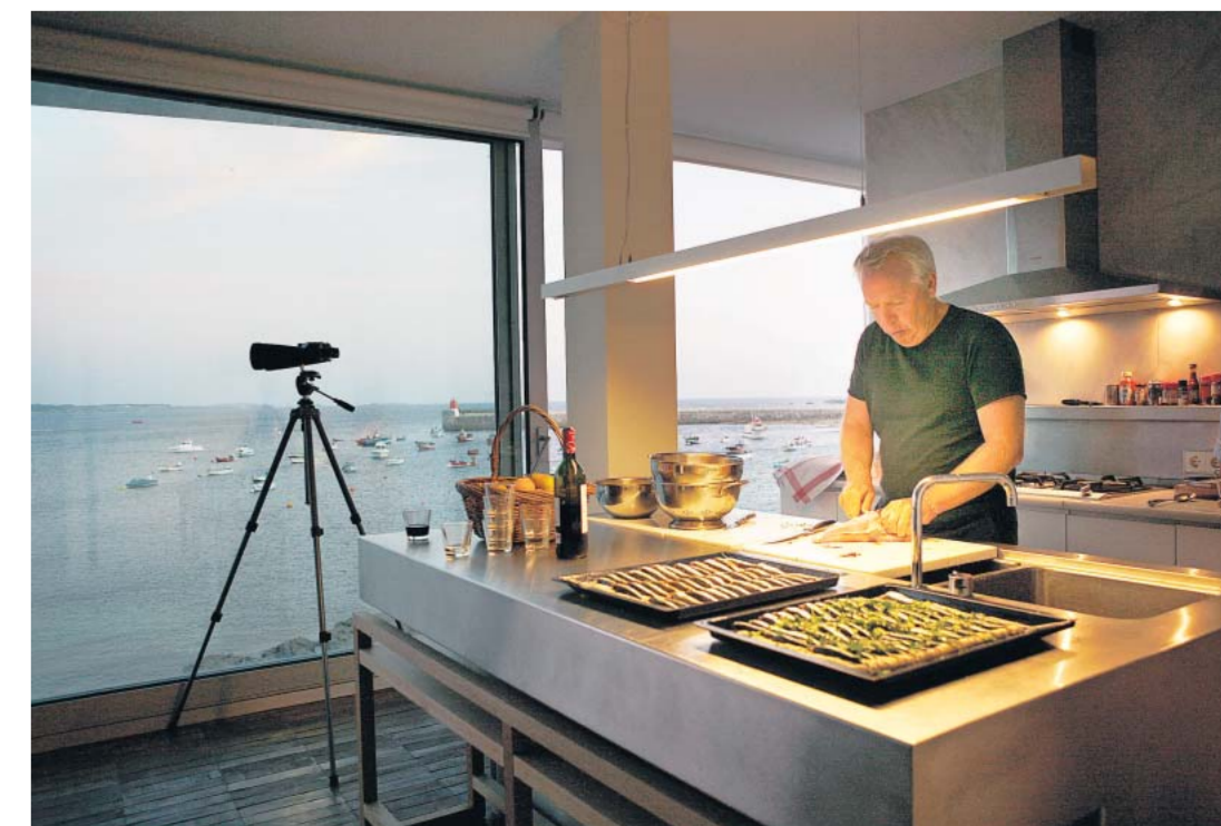
Aus der offenen Küche im Wohnzimmer kann David Chipperfield das Meer sehen. Nur: Worauf soll er sich da konzentrieren?