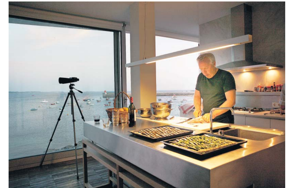
Aus der offenen Küche im Wohnzimmer kann David Chipperfield das Meer sehen. Nur: Worauf soll er sich da konzentrieren?