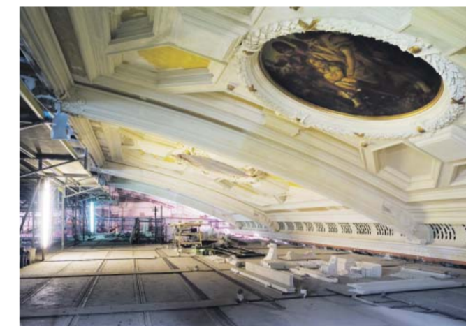
Gerade baut Chipperfield das Gesellschaftshaus im Frankfurter Palmengarten um.

findet, zieht sich über die ganze Länge des Wohnhauses eine Glasfront mit Aussicht über Bucht und Fischerboote hinaus ins Weite. Zur Straßenseite hingegen ist der Eingang leicht zu übersehen. Dort münden die vom Grundstück vorgegebenen Schrägen in einem winzigen, mit Kräutertöpfen vollgestellten Innenhof, den eine Schiebetür abschirmt. Das vierstöckige Haus liegt „mit den Füßen im Wasser“, wie es in der französischen Immobiliensprache heißt. Bei Flut schwappt das Meer gegen die Fundamente. Eine Rampe führt vom Felsenstrand hinauf zur unteren Etage. Dort sind die schmalen Kinderzimmer mit ihren Stockbetten wie Kabinen angelegt. Die deckartigen Terrassen und Balkons unterstreichen ebenso wie die dunkelbraunen Holzartigen Kacheln, die in Salerno handgemacht werden, den Schiffcharakter des Baus. Und an einer Seite des Wohnraumes wird gekocht wie in einer Kombüse.