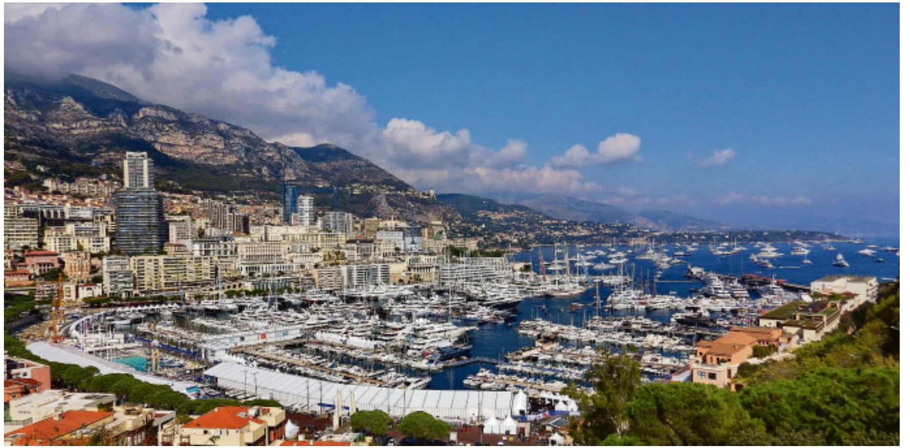
So sieht Monaco, wer mit dem Helikopter einschwebt. Nirgendwo sonst auf der Welt darf ein Mensch mehr Leben erwarten als hier: Fast 90 Jahre, sagen jüngste Statistiken.