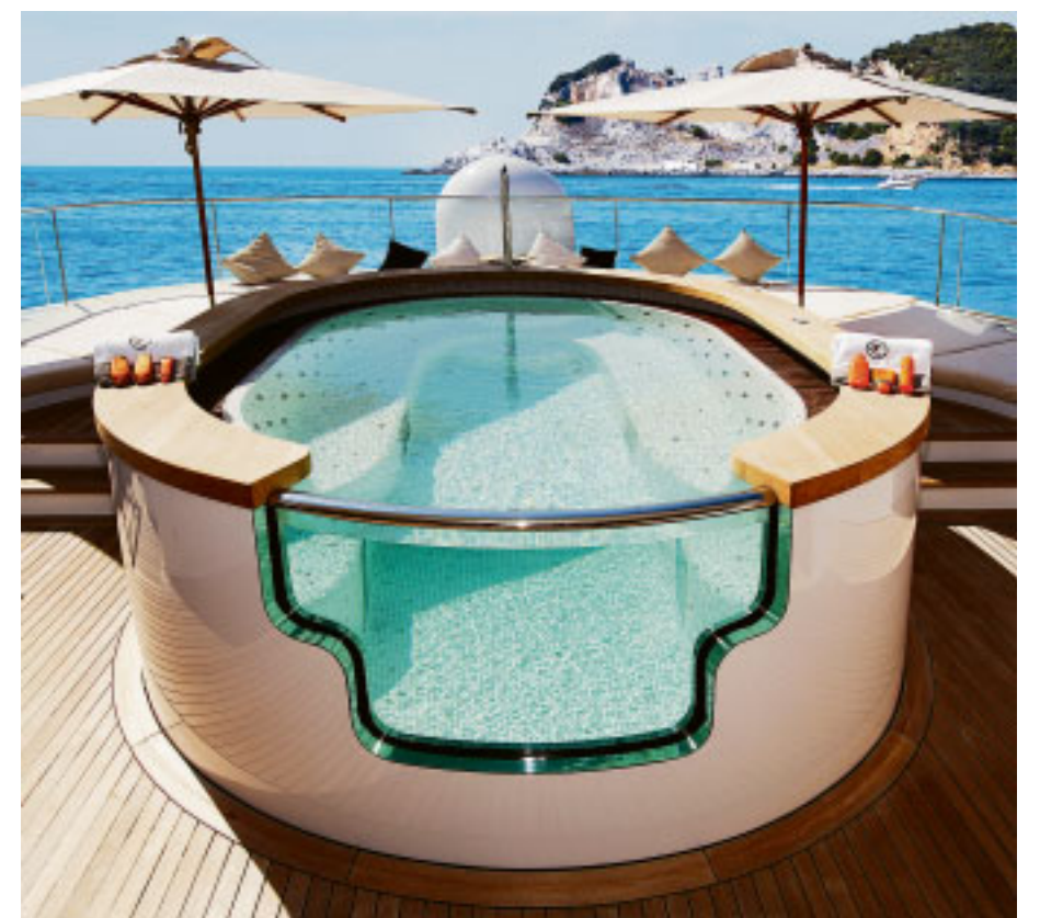
Das Meer ist nicht genug: Auf jeder Superyacht muss es Pools geben.