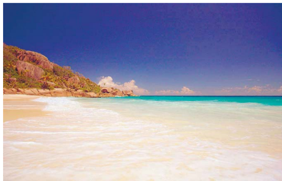
Der Urtyp der Tropeninsel ist nach dem Modell der Seychellen entworfen: Sand, Granitfelsen, Urwald. Und das Meer. Die Farben der Südseeinseln wurden hier erfunden.

auf eine Insel zu, nimmt man zuerst ihre Umriss und Ausmaße, später dann die Details genau wahr. Fährt man hingegen mit dem Auto über eine Insel, ist irgendwann die Straße zu Ende – oder man fährt ewig im Kreis, steht dann am Rand der weiten Wasserfläche und will doch hinaus. Nur der Blick aus der Distanz von der See her bringt wirklich Übersicht.