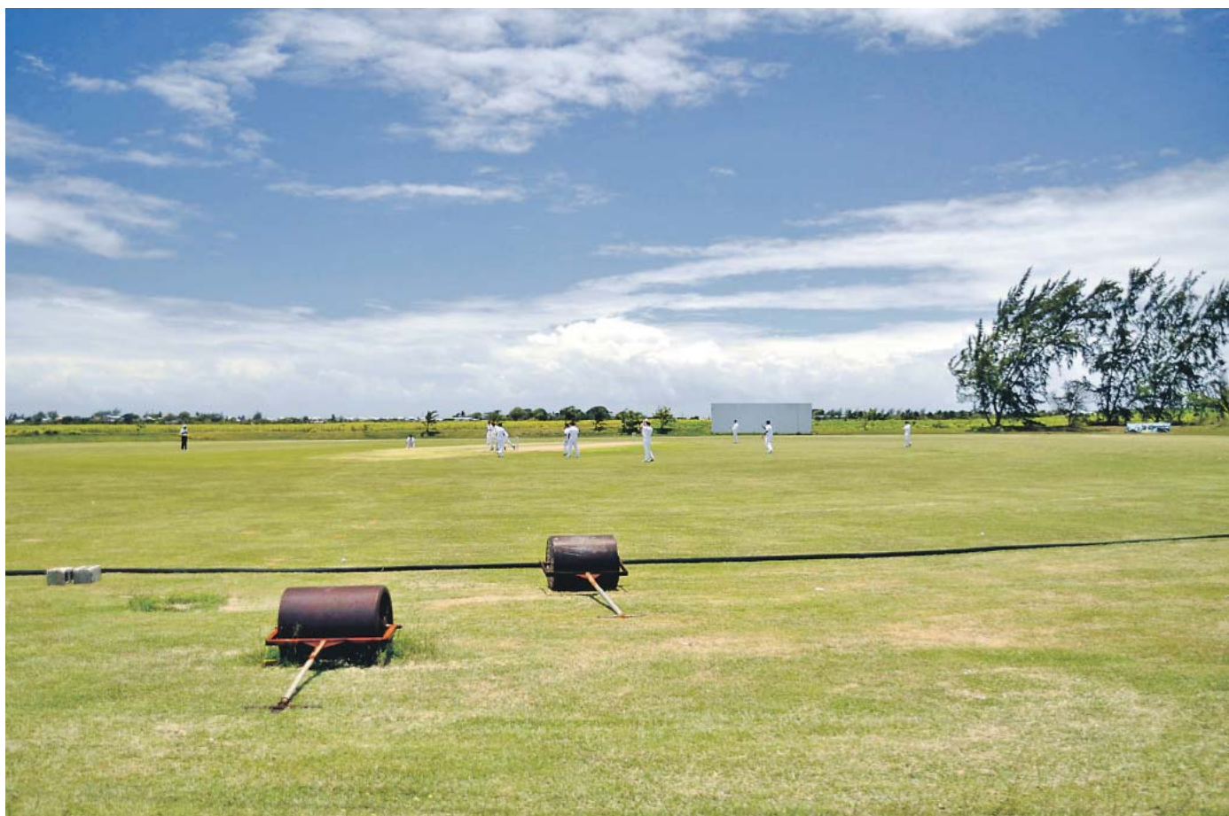
Mebr vom Land: Auf Barbados wachsen Zuckerrohr und perfekter Rasen – Letzterer eignet sich hervorragend zum Cricketspielen.