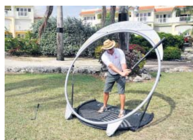
Bewegung! Golf im Explanar

Aber wir entscheiden uns dann doch für einen Liegestuhl, aus dem wir mit einem Rumpunsch in der Hand beobachten, wie die Profis das machen. Es war schon ein sehr sportlicher Tag auf Barbados. Was die Leute am Hotelstrand wohl so gemacht haben dieser Tage? IVO GOETZ