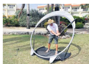
Bewegung! Golf im Explanar

Aber wir entscheiden uns dann doch für einen Liegestuhl, aus dem wir mit einem Rumpunsch in der Hand beobachten, wie die Profis das machen. Es war schon ein sehr sportlicher Tag auf Barbados. Was die Leute am Hotelstrand wohl so gemacht haben dieser Tage? IVO GOETZ