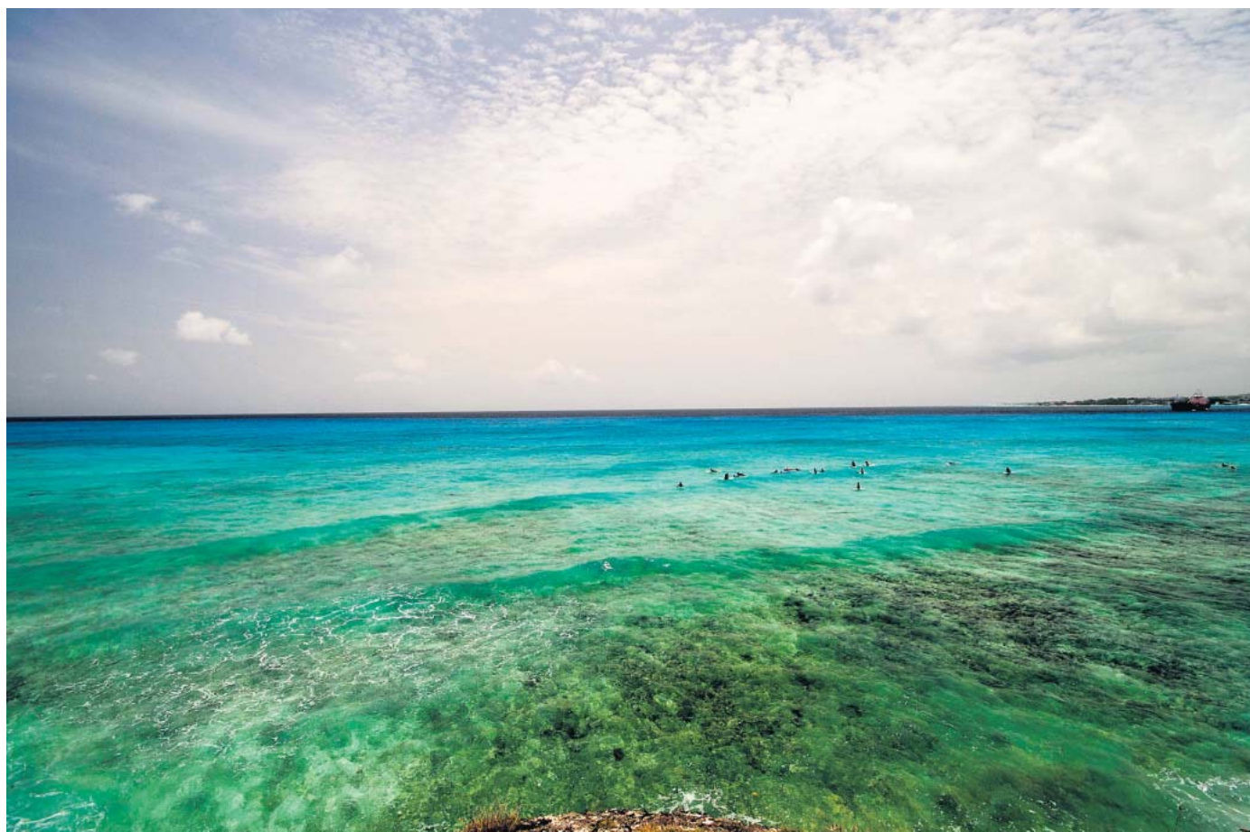
Mebr vom Meer: Die kleinen Wellen an der Südküste sind für Surferfänger geeignet. Köhner geben natürlich an die Ostküste.