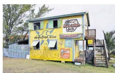
Bewegung! Talmas Surfcenter