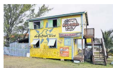
Bewegung! Talmas Surfcenter