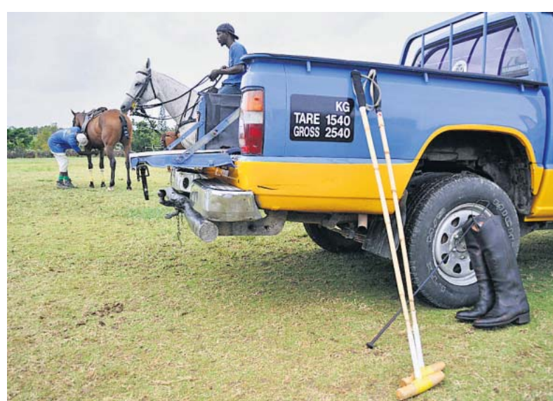
Und noch mal: Bewegung! Die Vorbereitungen zum Polo-Crashkurs