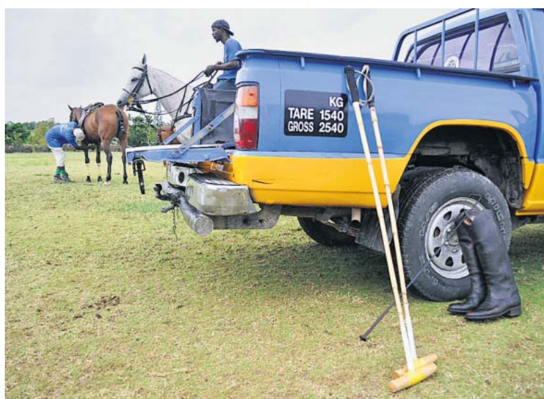
Und noch mal: Bewegung! Die Vorbereitungen zum Polo-Crashkurs