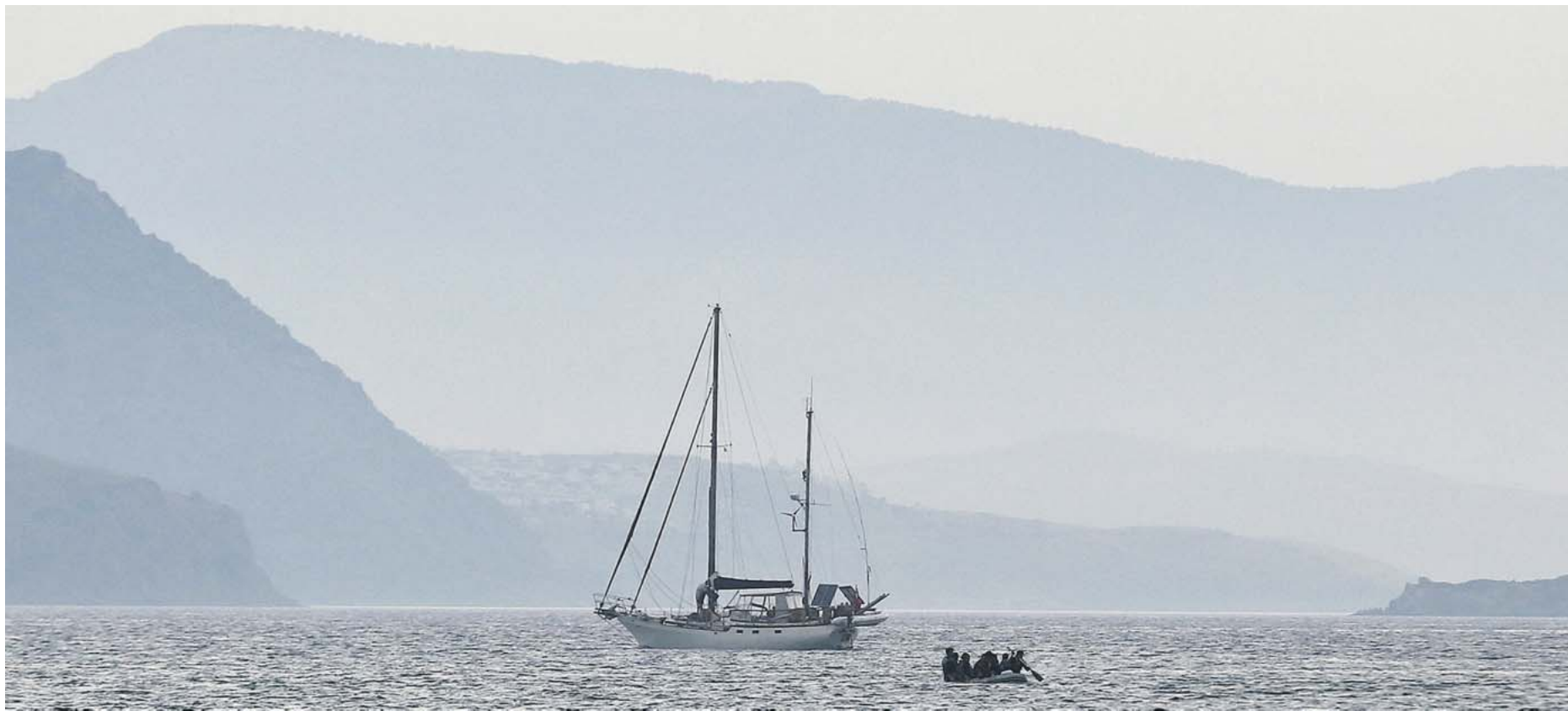
Nicht nur eine große touristische Spielfläche: Wenn Urlauber im Mittelmeer auf Flüchtlingsboote treffen, dann müssen sie handeln.

Bisher. Denn das Mittelmeer ist längst nicht mehr nur eine touristische Spielfläche. Flüchtlinge aus Syrien, Eritrea und Somalia, aber auch aus Sub-Sahara-Afrika versuchen täglich, dieses Meer zu überqueren. Im vergangenen Jahr kamen über 200 000 Flüchtlinge über das Mittelmeer nach Europa. 2000 ertranken. In diesem Jahr starben bereits knapp 2000 Menschen bei der Überfahrt. 190 000 haben es bisher geschafft. Viele gerieten in überfüllten, völlig seeuntauglichen Booten in Seenot. In den vergangenen Tagen waren es wieder Tausende, die von Schlepperbanden aufs Mittelmeer geschickt wurden. Hauptsächlich operieren diese Schlepper auf den Routen von Libyen nach Süditalien und im östlichen Mittel-